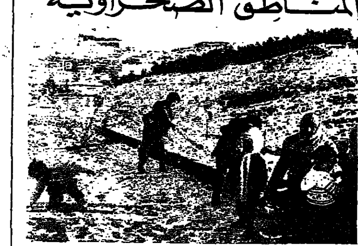
التلوغ في بلودان - سوريا

سالت موجة من البرد الشديد أنحاء الشرق الأوسط . وصحبها سقوط تلوغ اذت الى اربك الممر في الطرق والى تغطية مناطق صحراوية في ايران بها للمرة الاولى منذ ٥٠ عاما . وقامت سيارات جرف التلوغ في لبنان وفتح الطرق المؤدية الى سوريا في الوقت الذي كانت تتساقط فيه تلوغ جديدة . في حين فتحت سبلات رياضة التزلج على الجليد في منحدرات الجبل الواقعة الى الشرق من بيروت . وكان الساحل اللبناني مشمسا . ولكن درجة الحرارة التي بلغت ١٢ درجة مئوية كانت تحت المعدل الطبيعي بخمس درجات بالنسبة لشهر كانون الثاني كما انخفضت الى درجة مئوية واحدة بوادي البقاع . وسقطت التلوغ على جنوب الازنين . وحيث انخفضت الحرارة انخفضت الى ١٥ درجة مئوية تحت الصفر خلال الليل واصيب ١٥ شخصا على الاقل بجروح في وقت سابق بسبب انحراف سيارات وحافلات ركاب من الطريق بالقرب من عمان . ويقول خبراء الارصاد الجوية ان الموجة الباردة على وشك الانقضاء . وقالت وكالة انباء الجمهورية الاسلامية الايرانية ان التلوغ سقطت للمرة الاولى منذ ٥٠ عاما على صحراء